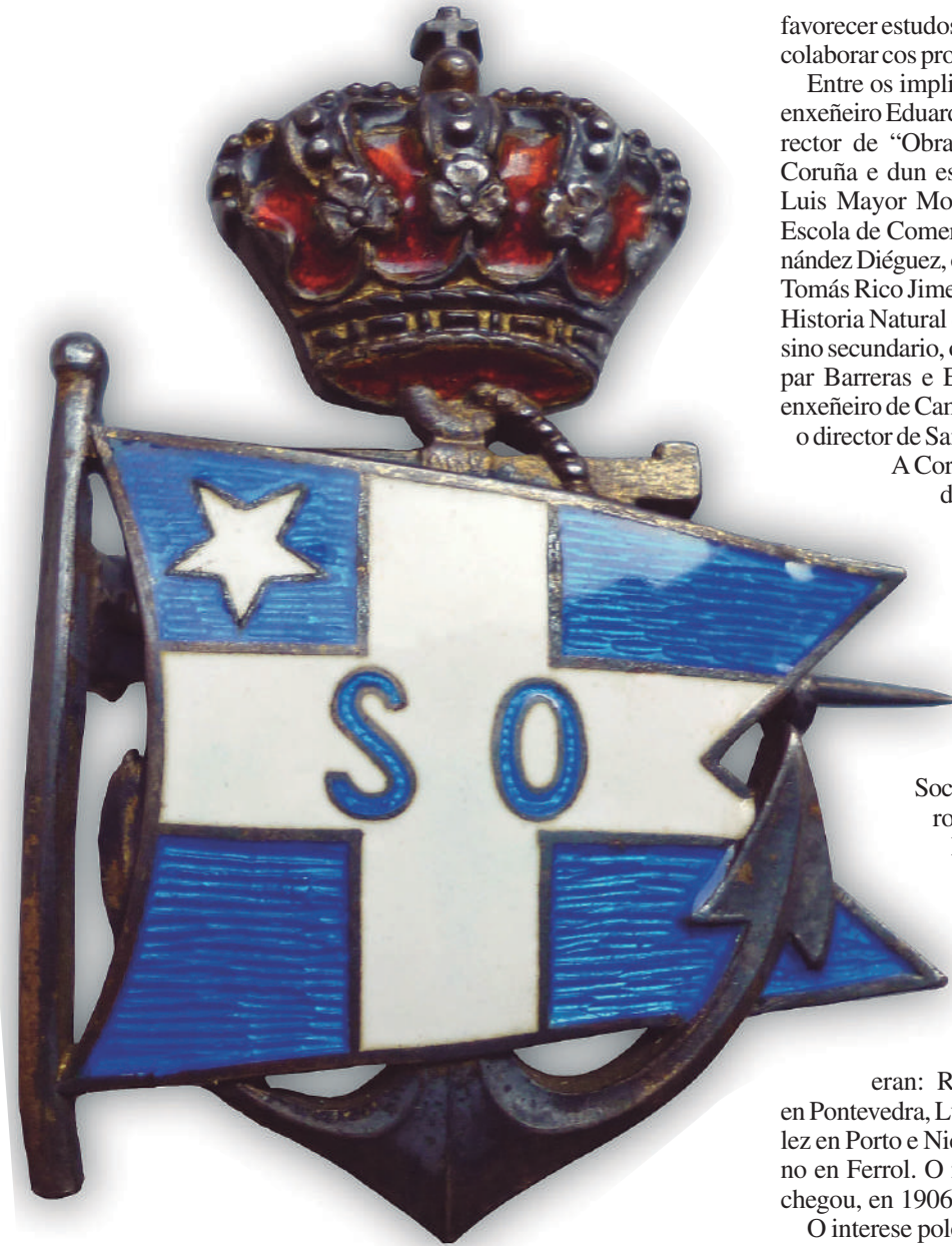
Insignia do Sub-Comité (Instituto José Cornide de Estudios Coruñeses)